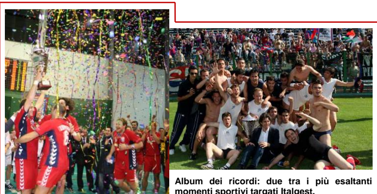
Album dei ricordi: due tra i più esaltanti momenti sportivi targati Italgest.

Le imprese che sino ad oggi anno aderito al Distretto sono 325, a queste si uniscono 12 enti locali, 7 tra università, politecnici e centri di ricerca, sindacati e associazioni di imprese. I dipendenti delle imprese aderenti al distretto sono oltre 5.000 e il fatturato relativo a tutte le imprese aderenti al distretto è approssimativamente stimato in oltre 2 miliardi di euro.